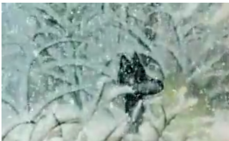
Норштейн, “Сказка сказок”. Снег под прелюдию Баха.