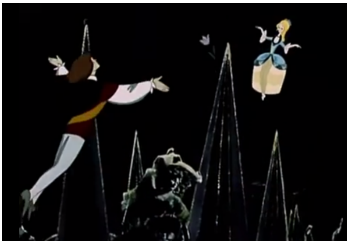
“Золушка”. «Где мы жили, как мы жили?»